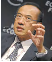
por George Yeo Yong-Boon, miembro del Consejo para la Economía del Vaticano

E n los últimos años, las empresas se han visto sometidas a presiones para dar más peso a los factores medio ambientales, sociales y de gestión, a los que se hace referencia con la sigla inglesa ESG (Environmental, Social and Governance). Cada año se elaboran listas, se asignan votos y se producen informes elegantes. No sólo las empresas